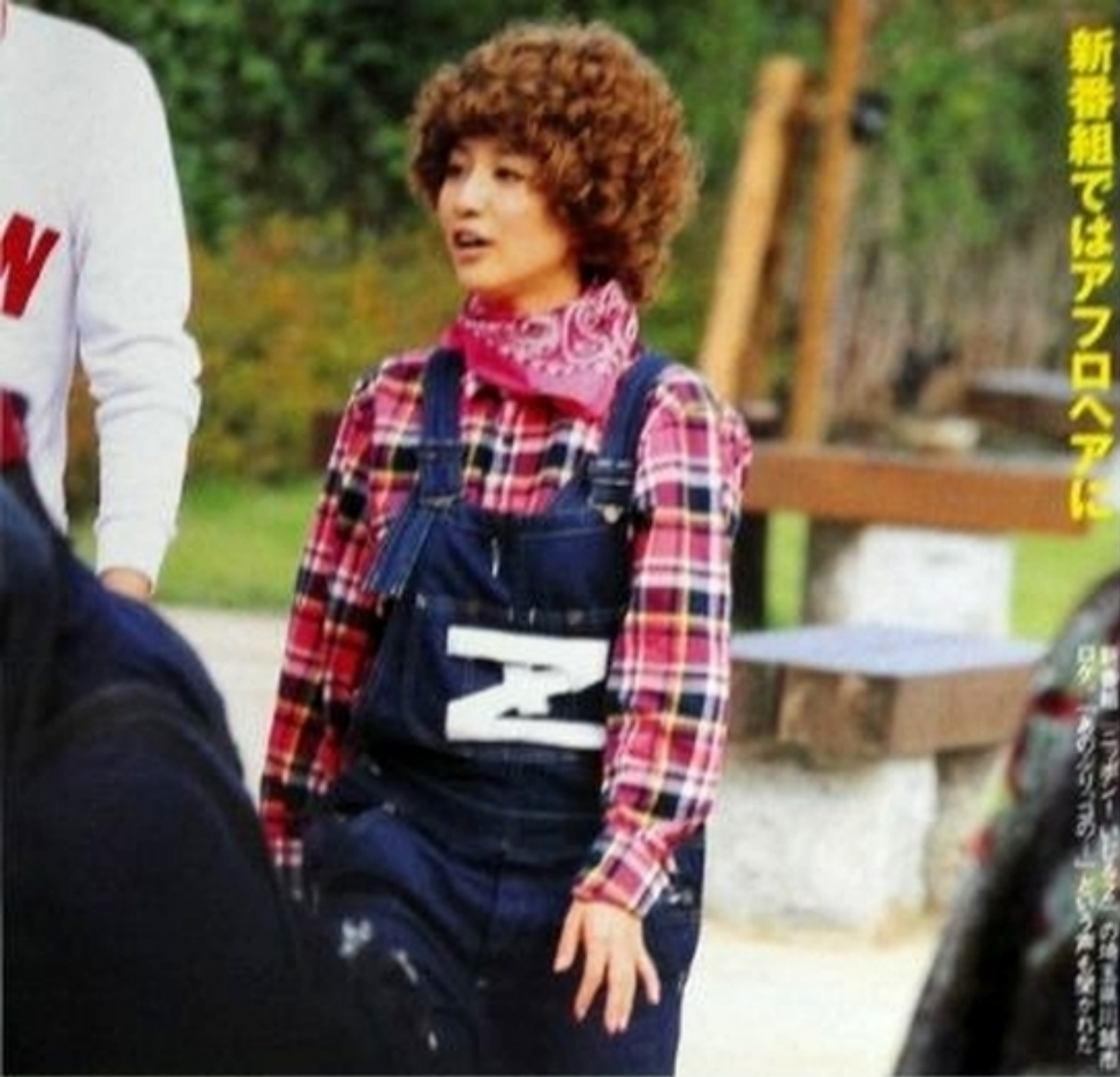
新番組ではアフロヘアに