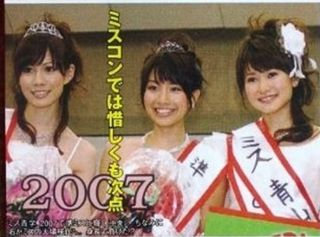
ミスコンでは惜しくも次点