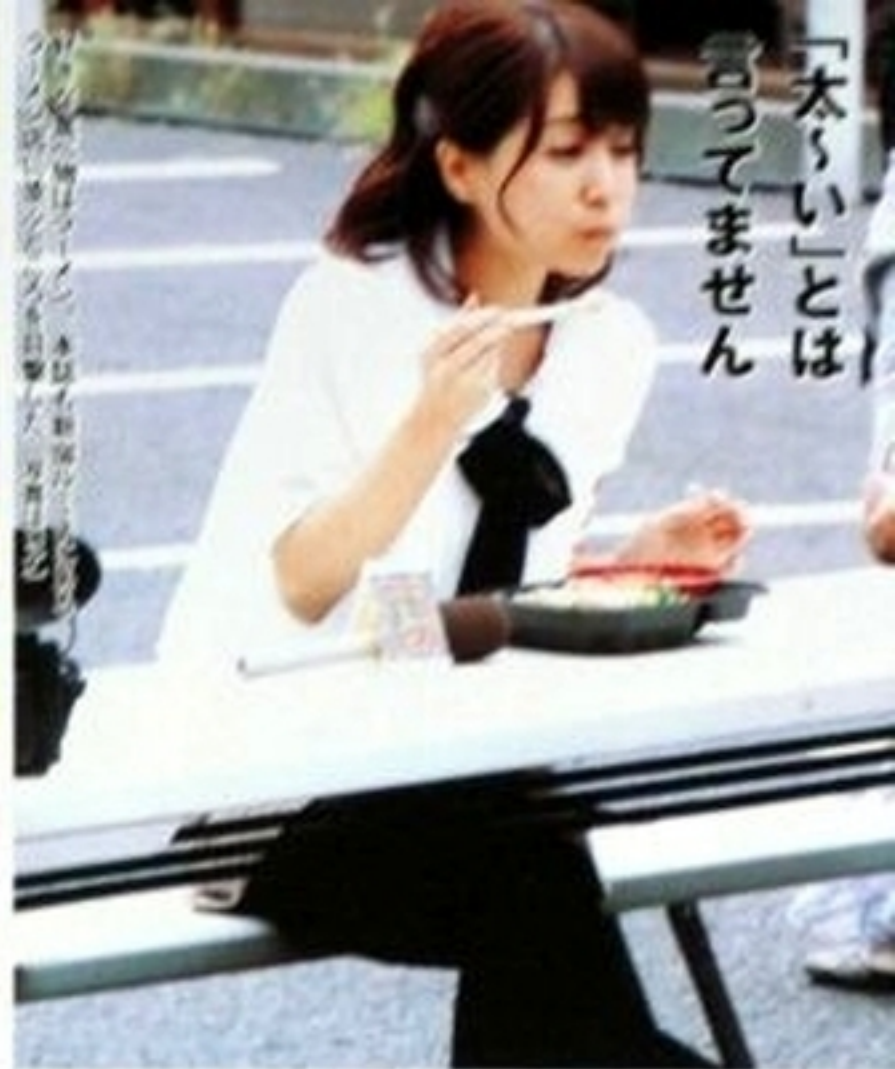
「太りい」とは 言ってますせん