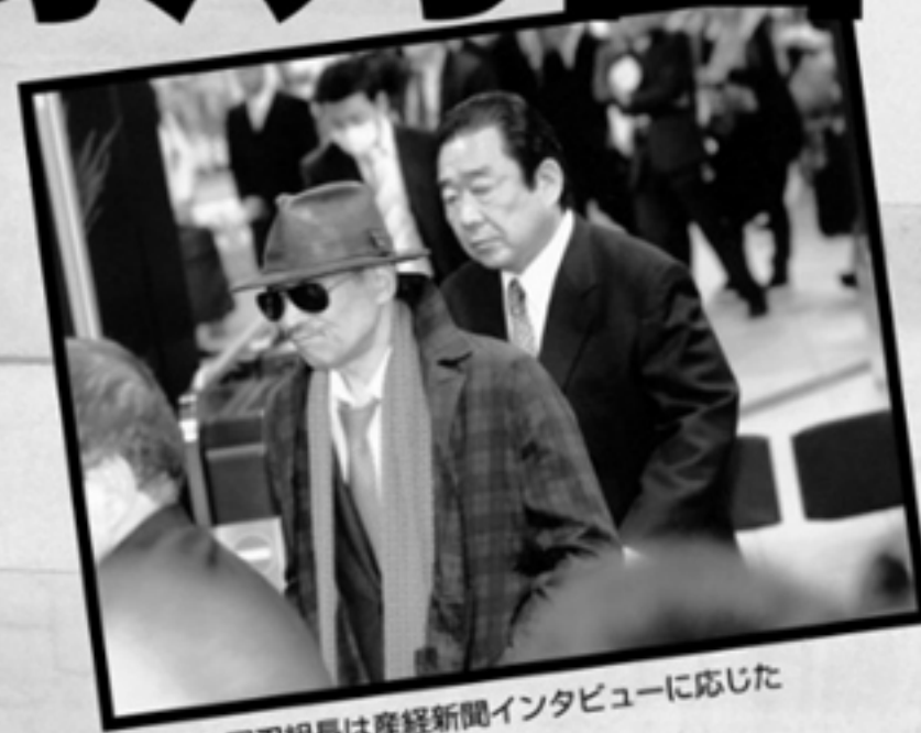
山口組の可忍組長は産経新聞インタビューに応じた