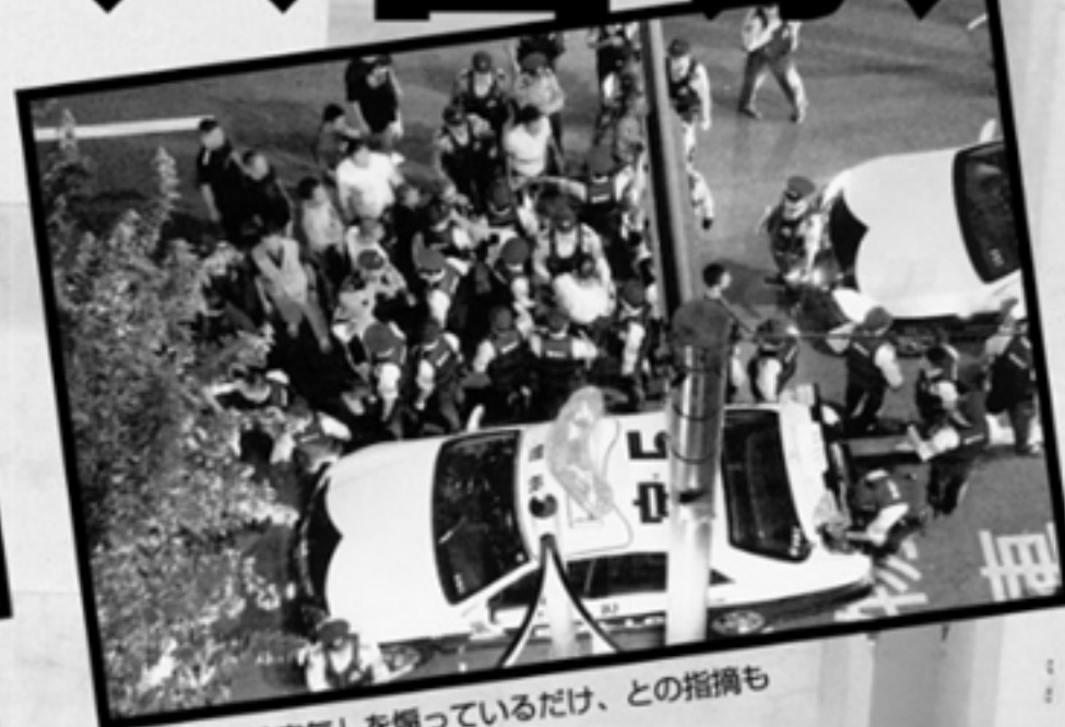
警察は「暴排空気」を煽っているだけ、との指摘も

島田紳助が8月23日に引退の記者会見をしてから、ほぼ2カ月。案の定、水面下に徐々に沈んでいく気配がある。最初は沖縄本島の恩納村のマンションである。メディアのカメラマンに包囲されてウンザリしたのか、9月中旬、本島の上側、東村のペンションに移った。面倒を見たのは兵庫県警OBというキヤクラ経営者のようだ。10月初旬にはまた別の場所に移る逃避行である。紳助は仕事もせず、いったい何から逃げているのか。もちろん芸能界を自ら進んで引退したのだから、芸能畑から再びお声がかかることは期待できない。引退後、紳助の悪評は公然と語られ始め、今では山口組・高山清司若頭