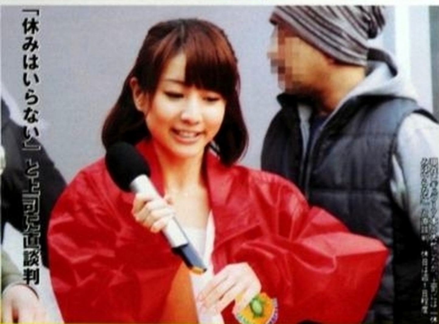
「休みはいらぬい」として可成り直談判